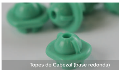
Topes de Cabezal (base redonda)