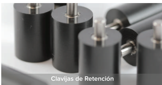
Clavijas de Retención