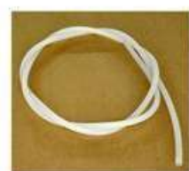
Manguera de silicón