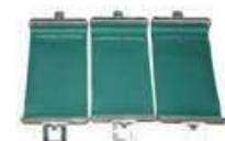
3 clip para taza