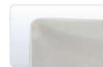
Membrana de silicón